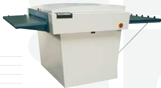
显示中包含额外可选件